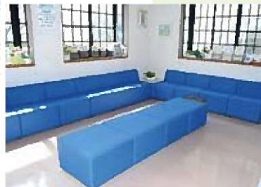
▲ブルーのソファーが印象的な待合室