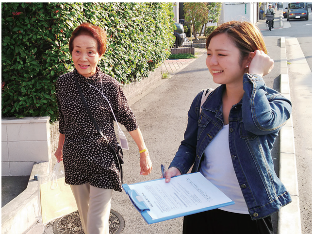
職員と友の会が力を合わせて頑張ります！