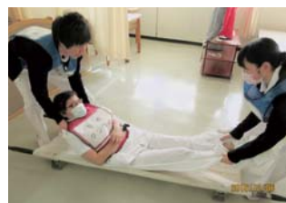
▲入院患者の搬送訓練

職員64名参加のもと、秋季消防訓練を実施しました。訓練に際しては仮想16階病棟5号室より夜間火災発生を想定し、夜勤者による限られた人数で、火災発見から初期消火、院内連絡、消防署への通報、対策本部の立ち上げ、指示命令の訓練、タンカや車椅子による入院患者の避難活動を実施しました。