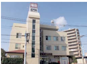
暖かい雰囲気の待合室▶