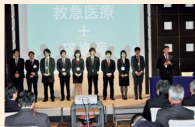
▲第1部 初期研修医紹介