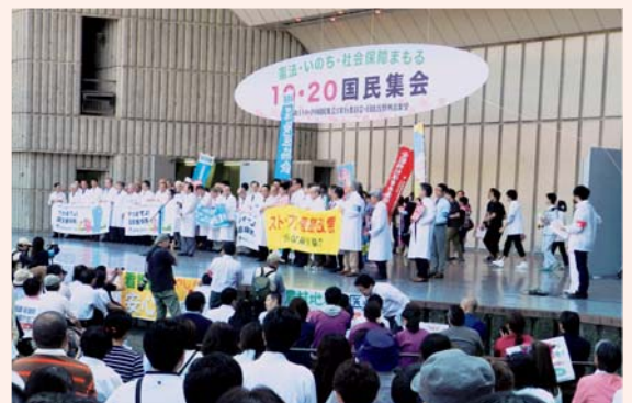
▲全国から3000人超が集まりました。集会後にはサウンドデモを行い、「憲法まもれ」「いのちまもれ」とアピールしました。