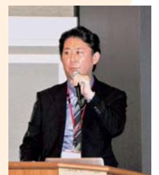
▲第1部 脳神経外科紹介(米田医師)