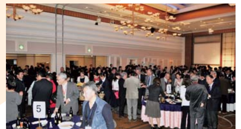
▲第2部 懇親会は多くの参加で和やかな雰囲気