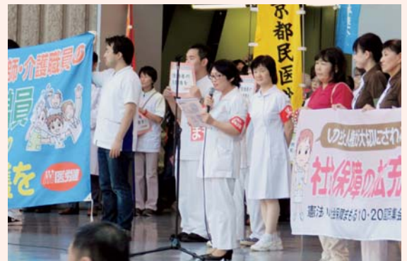
▲各医療団体から発言アピール