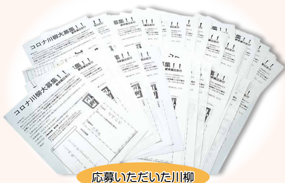
応募いただいた川柳

新型コロナウイルス感染症の影響で友の会活動も思うようにできない日々が続く中、「コロナと社会保障」をテーマとして、笑い、怒り、皮肉を込めて、ほんの少し憂さ晴らしをしよう、と職員と友の会が一緒に取り組みました。141句の応募作から、院長・総院長・事務長・国民運動委員により優秀賞の選考が行われます。入選作品は大手町病院1Fのエスカレーター前に掲示されます。