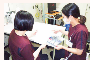
入会セットを活用しました

各職場に入会セット(入会申込書、会員の特典、活動の様子が見られるパンフレット、協同基金の案内)を配布して、患者さんや出入りのある業者さんへの声掛けを促しました。インフルエンザのワクチン不足では皆様にご不安な思いをさせてしまいましたが、問い合わせがあった際には入会の声掛けを行い、外来からの入会がありました。健診課も受診者に友の会を紹介して会員が増えました。病棟では13階病棟が特に積極的に声掛けを行い、多くの入会がありました。